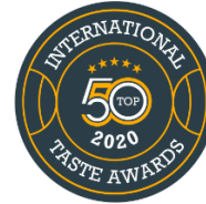
ITA 2020 Top50