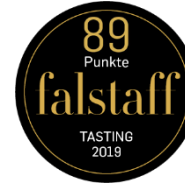
Falstaff 2019 89 Punkte