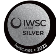
IWSC 2023 Silver Medal