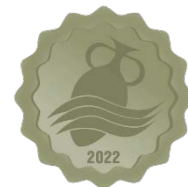
Epulae 2022 Anfora Platino