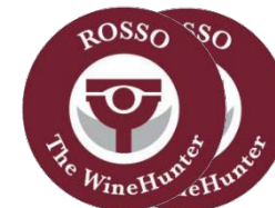
ROSSO The WineHunter The WineHunter Rosso Award