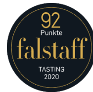
92 Punkte falstaff TASTING 2020