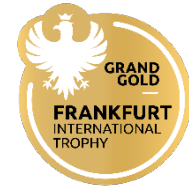
FI Trophy® 2023 Grand Gold Medal