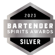
Bartender Spirits Awards 2023 Silver Medal